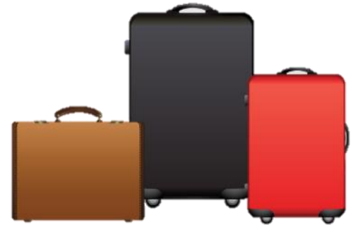
น้ำหนักกระเป๋า 20 กิโลกรัมต่อท่าน

** เนื่องจากเป็นตั๋วเครื่องบิน จึงไม่สามารถระบุเลขอาคารได้ **