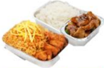
บริการอาหารร้อน ไป-กลับ บนเครื่อง

** เนื่องจากเป็นตั๋วเครื่องบิน จึงไม่สามารถระบุเลขอาคารได้ **